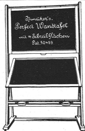
Hunziker Söhne SCHULMÖBEL-FABRIK Thalwil Telephon 111 Wandtafeln Schulbänke, Bestuhlungen

Ausführung von Chalets, innerer und äusserer dekorativer Holzarbeiten, Zimmereinrichtungen