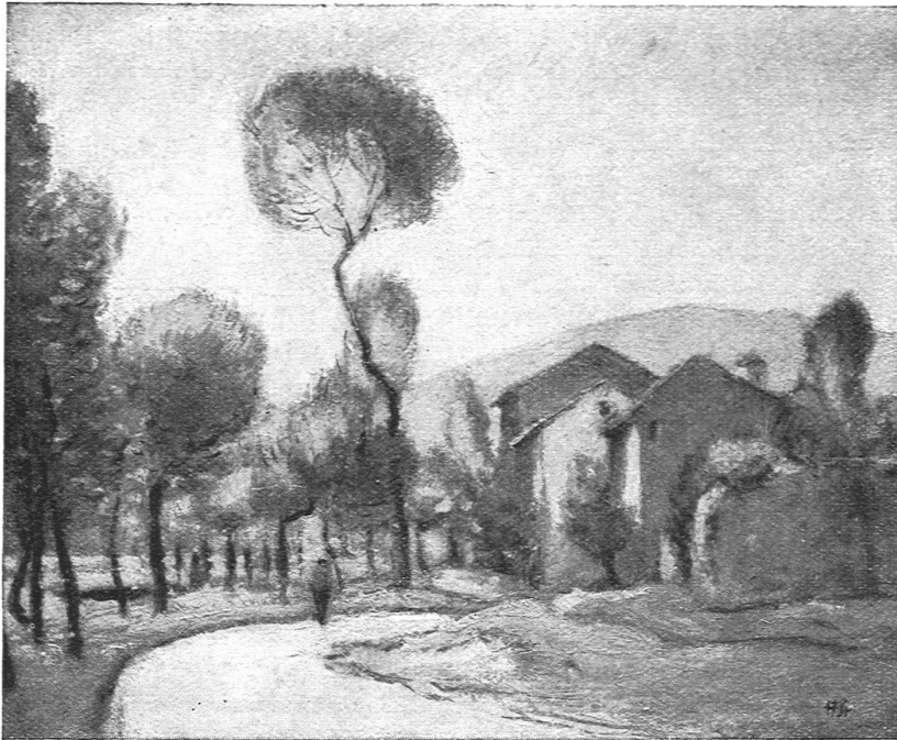
HANS STURZENEGGER, ZÜRICH / LANDSCHAFT

sichtbar waren, und dem weiten Raum, der sich über ihnen erhob: Es war, als ob die Gestalten des »Tages« sich auch wirklich erheben könnten. Man braucht nicht an die Miniaturdistanzen zu denken, denen Hodlers »Blick ins Unendliche« notwendigerweise ausgesetzt ist, um sich darüber zu freuen, dass wenigstens einmal für kurze Wochen einige Hauptwerke Hodlers in Räumen und Distanzen zu sehen waren, die die Internität und Kraft seiner Werke voll zur Geltung kommen liess. Die gleichen Vorzüge der Aufstellung kamen auch dem Porträt des Fräulein Müller zugut, wo die Einheitlichkeit der Komposition, der grosse Zug, der durch das ganze Bild geht, vielleicht nie mehr so stark in Erscheinung treten werden. Als stillere Begleiter schlossen sich diesen grossen Kompositionen einige imposante Landschaften aus Hodlers Spätzeit an und einige Hauptwerke von Buri, die durch die Arbeiten seines grössern Friends erst recht zur Geltung kamen.