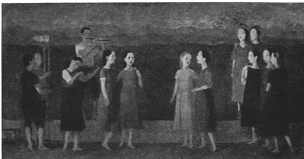
WALTER CLÉNIN, WABERN / ENTWURF FÜR EIN WANDBILD