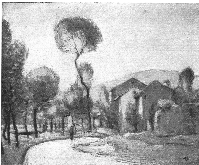
HANS STURZENEGGER, ZÜRICH / LANDSCHAFT

sichtbar waren, und dem weiten Raum, der sich über ihnen erhob: Es war, als ob die Gestalten des »Tages« sich auch wirklich erheben könnten. Man braucht nicht an die Miniaturdistanzen zu denken, denen Hodlers »Blick ins Unendliche« notwendigerweise ausgesetzt ist, um sich darüber zu freuen, dass wenigstens einmal für kurze Wochen einige Hauptwerke Hodlers in Räumen und Distanzen zu sehen waren, die die Internität und Kraft seiner Werke voll zur Geltung kommen liess. Die gleichen Vorzüge der Aufstellung kamen auch dem Porträt des Fräulein Müller zugut, wo die Einheitlichkeit der Komposition, der grosse Zug, der durch das ganze Bild geht, vielleicht nie mehr so stark in Erscheinung treten werden. Als stillere Begleiter schlossen sich diesen grossen Kompositionen einige imposante Landschaften aus Hodlers Spätzeit an und einige Hauptwerke von Buri, die durch die Arbeiten seines grössern Freunds erst recht zur Geltung kamen.