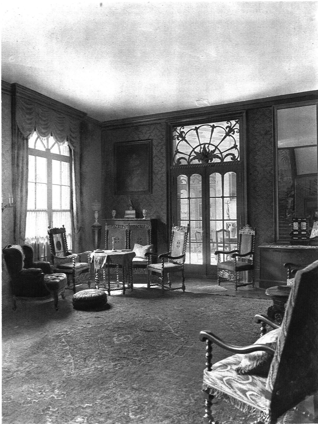
EMPFANGSHALLE IN UNSEREM AUSSTELLUNGSHAUSE J. KELLER & CIE., MÖBELFABRIK, ZÜRICH