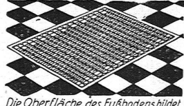
Die Oberfläche des Fußbodens bildet mit der Matte eine ebene Fläche