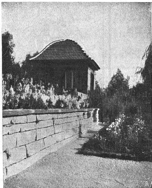
A. Bodmer, Zürich-Wollishofen Gartenbau

Gegr. 1862 / Goldene Medaille S.L.A.B. 1914 / Gegr. 1862