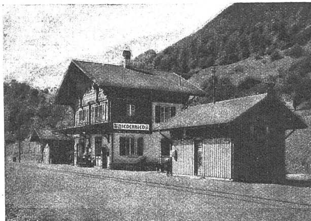
STATION DER BRIENZERSEEBAHN, ETERNIT-DOPPELDACH, KUPFERBRAUN