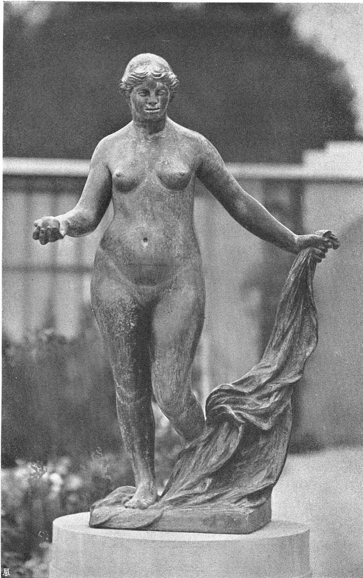
Renoir, Eve, im Garten G. Reinhart, Winterthur

diesen Plastiken, die in ihrer Unbefangenheit etwas für uns leider fast Fremdgewordenes an sich haben. Man hat auch keinen besonderen Anlaß, die meisterhafte Gebärde zu bewundern, wie etwa bei Degas' kleinen Plastiken, der Wert Renoirscher Plastik liegt viel tiefer. Aber man muß eine Figur wie seine Eva im Freien gesehen haben, umgeben von Bäumen, Blumen und Früchten, um sich ein richtiges Bild von ihrer Ursprünglichkeit zu machen. Selbst