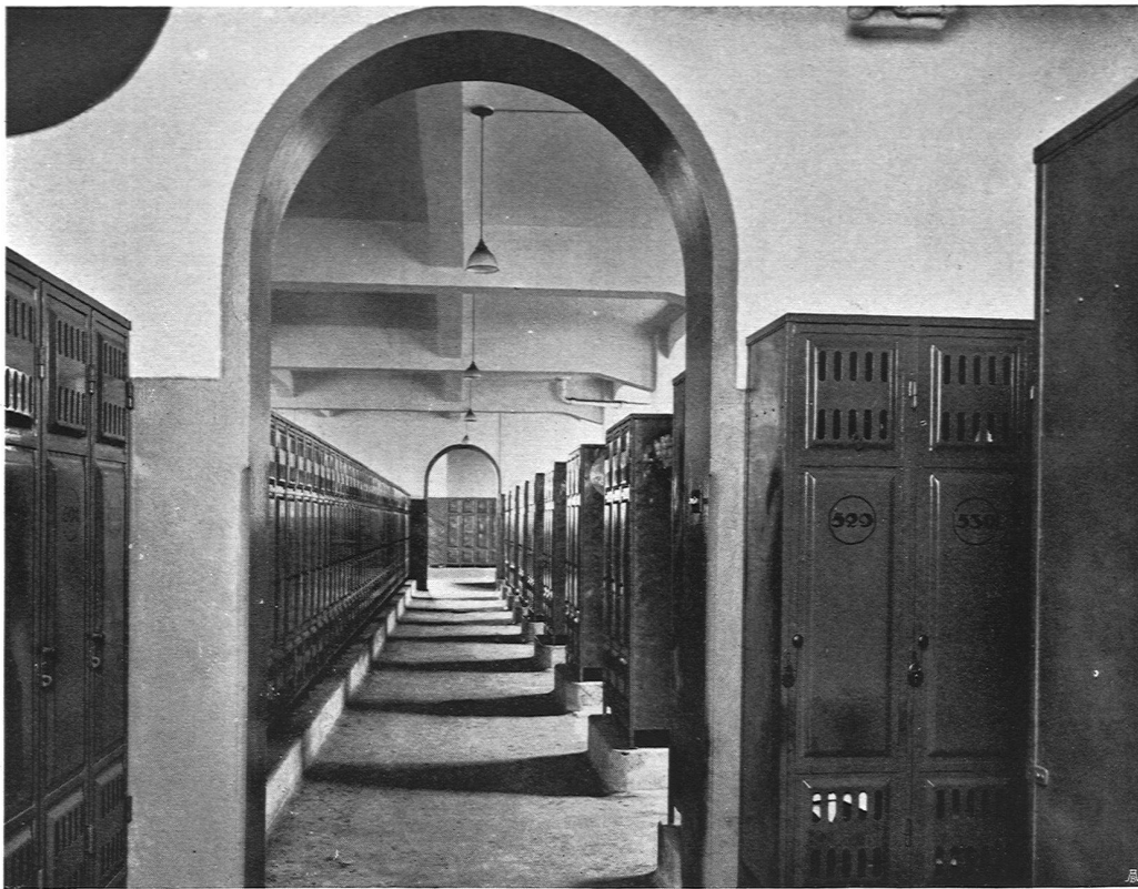
Arbeitergarderobe Hochparterre in der Bad- und Speiseanstalt der Chemischen Fabrik vorm. Sandoz A.-G. Basel

auf die Spur zu kommen und ihre Entwicklung in zweckmäßiger Weise zu sichern. Dieser planmäßigen Ausbildung des Nachwuchses an hochstehenden Arbeitskräften gilt es volle Aufmerksamkeit zu widmen. Die systematische Zusammenarbeit von Wissenschaft und Wirtschaft bildet ein weiteres Problem, das weitgehendes Interesse fordert. Die schweizerische Versuchsanstalt für Textil-, Leder- und Seifenindustrie in St. Gallen bildet für die Schweiz einen ganz bescheidenen Anfang, den es zielstrebig zu entwickeln gilt. Die Erhöhung der Wirtschaftlichkeit des schweizerischen Produktionsgebietes umfaßt im weiteren die vermehrte Intensität der Elektrifizierung, den Ausbau der Flußschiffahrtswege. Für die Absatzfrage der Schweizererzeugnisse tritt die Notwendig-