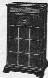
Elektrischer Accumulirofen „Primulus“

Elektr. Accumulir-Oefen in diversen Grössen und Konstruktionen