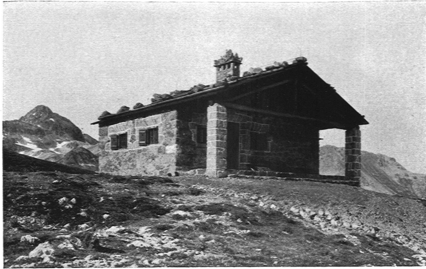
Skiklub Alpina St. Moritz. Skihütte Corviglia am Fuß des Piz Nair, 2500 m. ü. M. erbaut 1912. Architekten Emil Weber und Karl Zaeslin (damals beide Mitarbeiter der Nikolaus Hartmann & Cie. B. S. A. St. Moritz). Unten: Vorderansicht und Grundriß