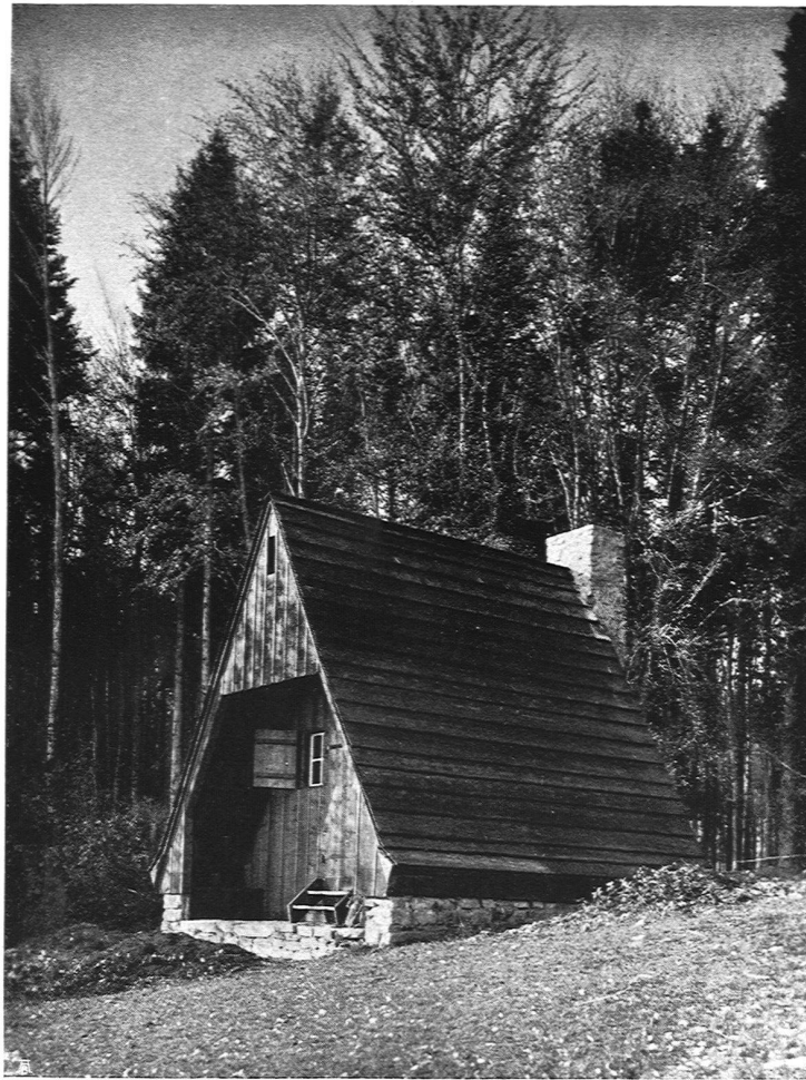
Architekten P. Artaria und K. Zaeslin, S.W. B. Basel

ihrer Schriftleitung erfolgt, mag alpinen Kreisen erwünscht sein.