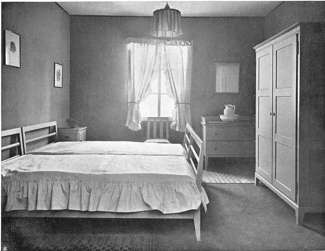
Fachschule für Innenausbau. Schlafzimmer, tannen, gestrichen. W. Kienzle Ausführung: Städtische Lehrwerkstätten für Schreiner, Zürich

Heute sind eine Anzahl fertiger Teppiche in die Ausstellung einbezogen und hier in zwei Abbildungen vorgeführt. Wir wollen sie Proben nennen; sie sind vorläufig nur im kleinen Ausmaß als Bett-, Diwan- und Schreibtischvorlagen gearbeitet. Sie können aber auch größer hergestellt und in der Farbenzusammenstellung dem Raum eingepaßt werden. Die ersten Anfänge wären nun gegeben; die einfache Technik