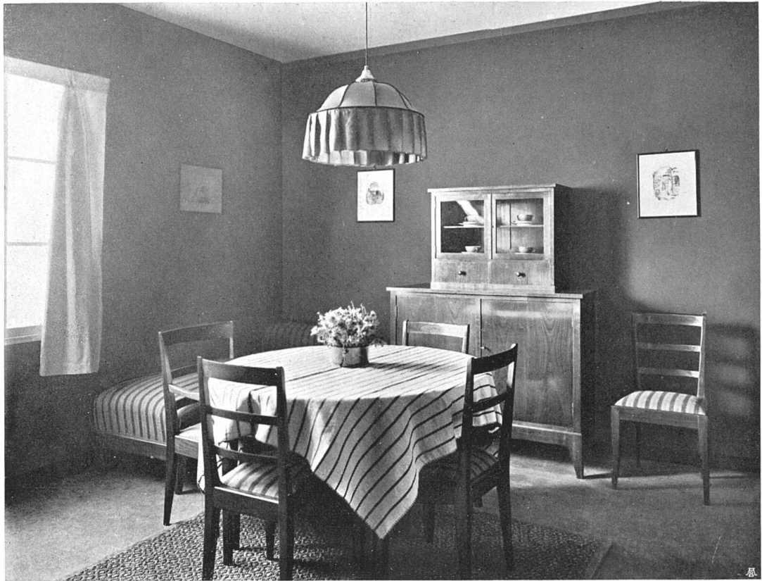
Fachschule für Innenausbau, Wohnzimmer in Kirschbaumholz, W. Kienzle Ausführung: Städtische Lehrwerkstätten für Schreiner, Zürich