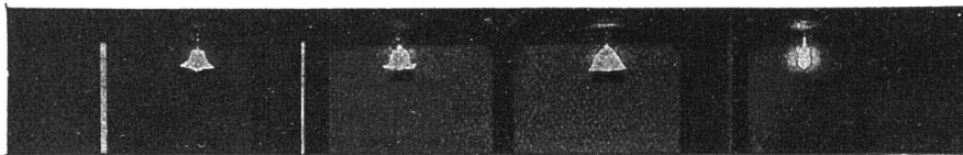
Photographie der Kabinen mit obenstehenden Lichtquellen beleuchtet