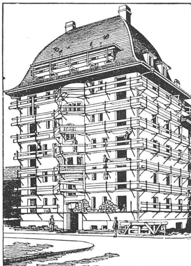
Ansicht eines eingerüsteten Hauses

Einfachstes und schnellstes Verfahren im Eingerüsten