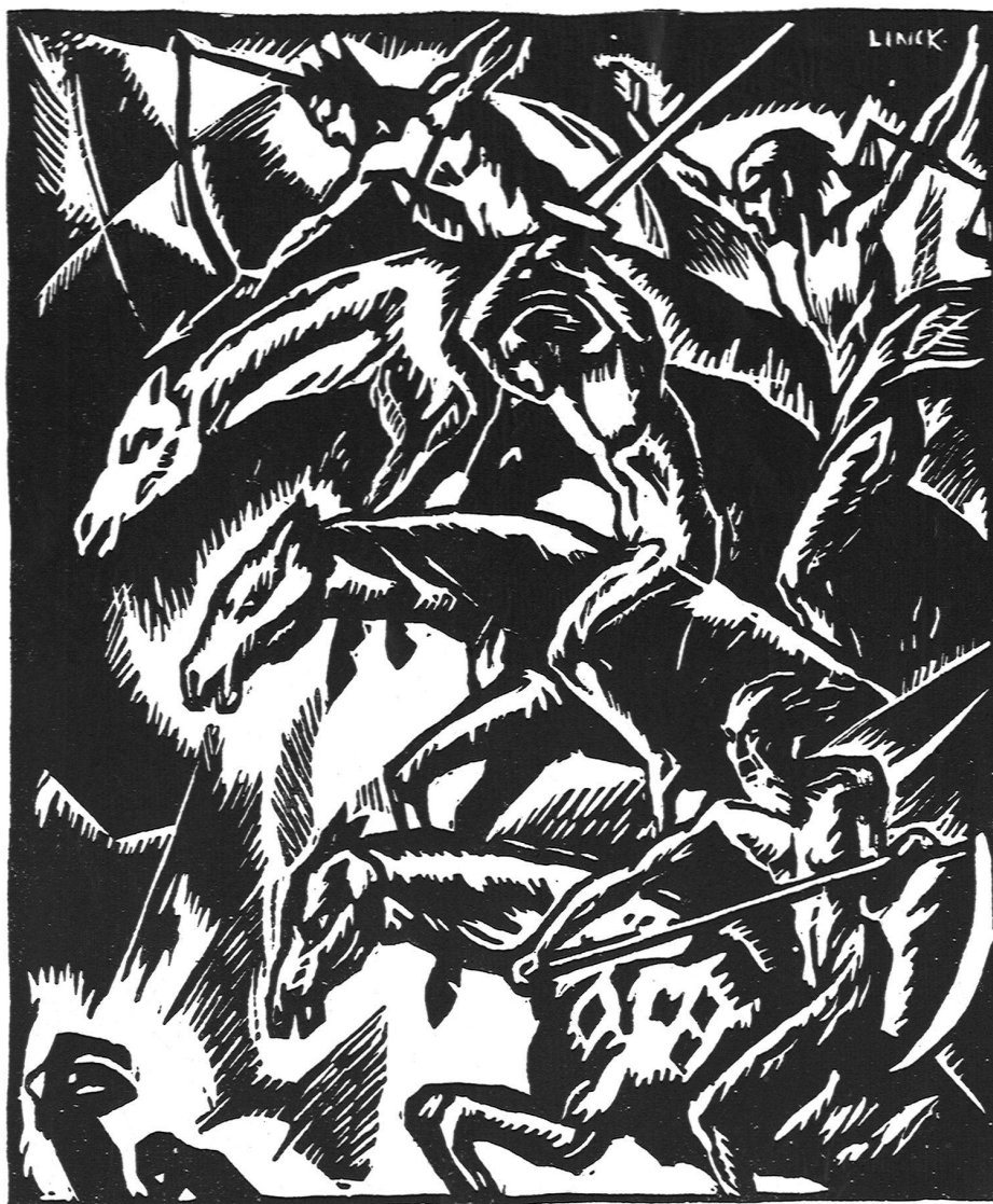
Ernst Linck, Bern: Die apokalyptischen Reiter. Aus: „O mein Heimatland“, Kalender, G. Grunau, Bern

bewährten Blendwerk die kaum erwachte bessere Erkenntnis zu verwirren und mit mächtigen äußern Mitteln seinen Einfluß, der die Entwicklung alles Echten und Gesunden hindert, zur Herrschaft zu bringen. Durfte man noch vor zwei Jahren von einer allgemeinen Selbstbesinnung das Heil erhoffen, so müssen wir heute die befremdliche und widrige Erfahrung machen, daß von neuem den Vertretern deutscher Kunst durch freche Herausforderung, wie sie in der unentwegten Rechtfertigung