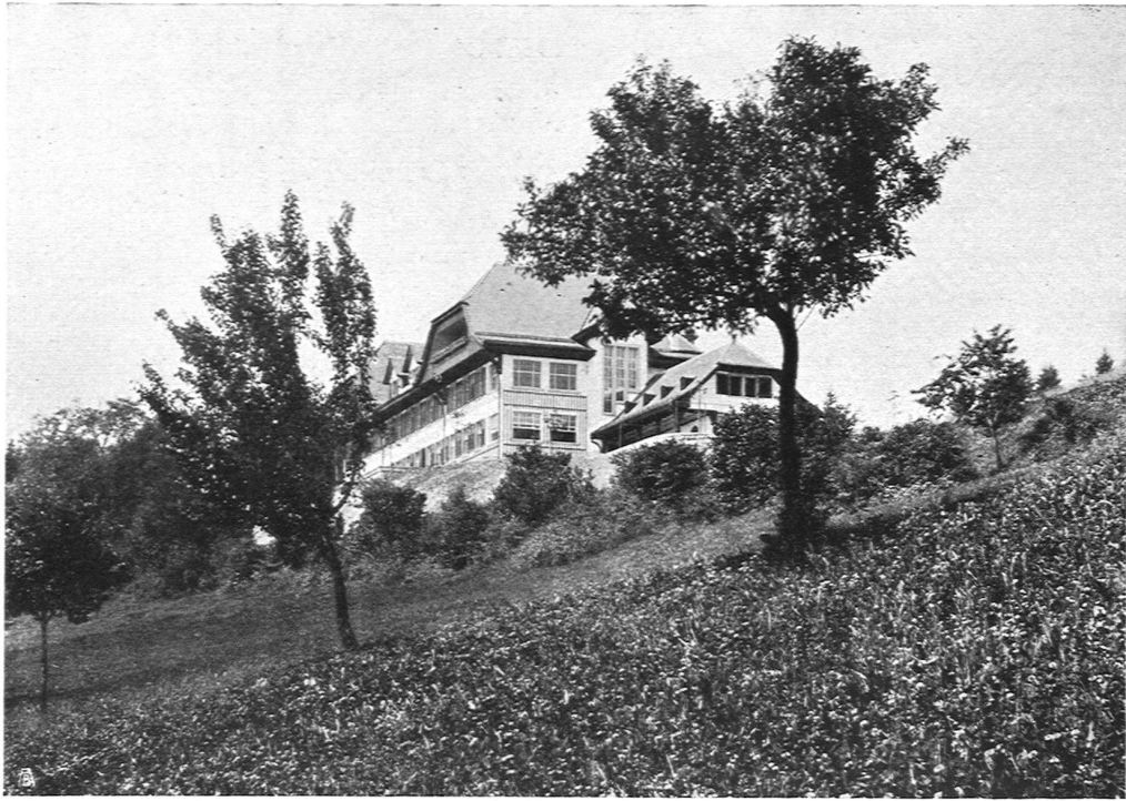
Das Kindersanatorium „Maison blanche“ in Leubringen ob Biel

Architekten B. S. A. Moser & Schürch, Biel