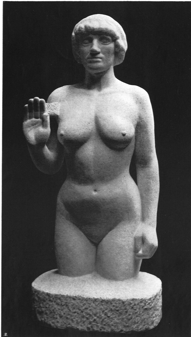
Otto Roos Basel