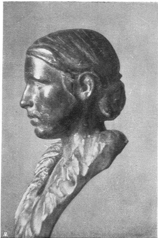
Otto Roos, Basel. Büste von Frau Z. (Bronze)

zu ihrer allgemeinen Grundlage vor allem die ägyptische und die frühgriechische Plastik hat. Aber all das bedeutet nur den allgemeinen Ausgangspunkt, von dem aus sich Roos längst zu einem selbständigen, stark persönlichen Stil entwickelt hat.