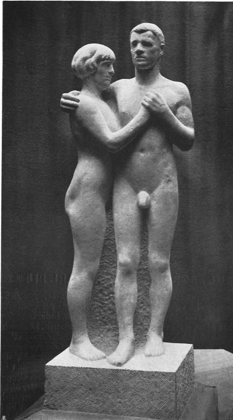
Otto Roos Basel