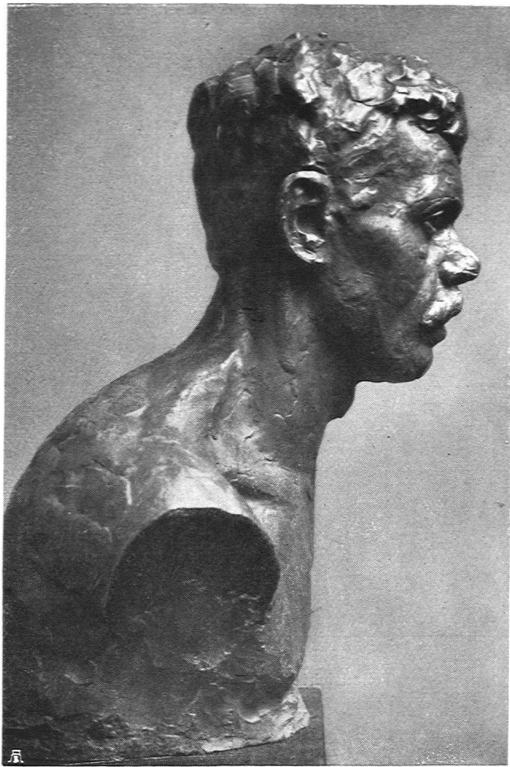
Otto Roos, Basel. Büste von Karl Dick (Bronze)