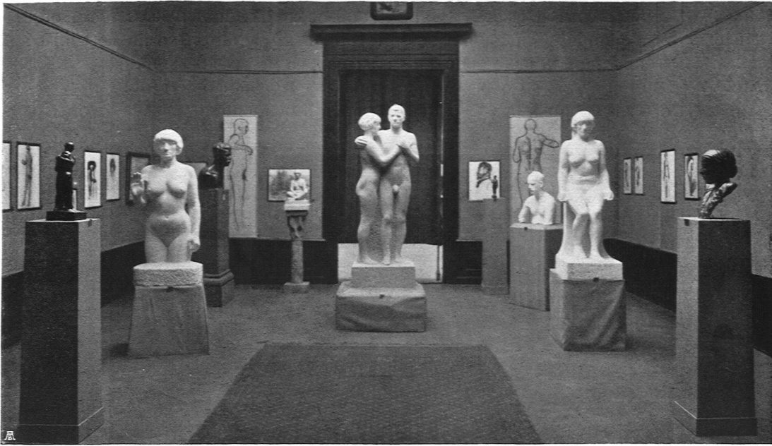
Otto Roos, Basel