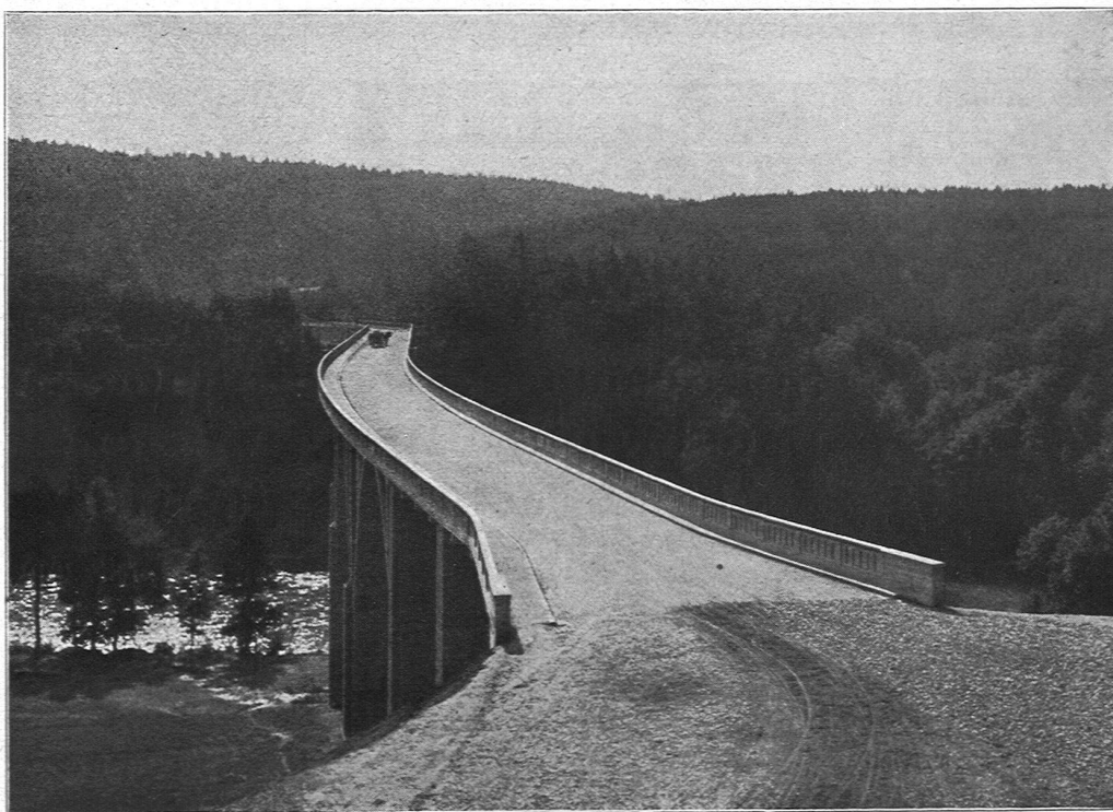
Halenbrücke bei Bern

bitten wir die geehrten Abonnenten, nebst der neuen auch die alte Adresse anzugeben. Der Verlag, Das Werk N. & G.