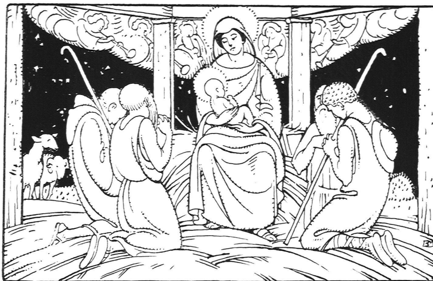
Illustration aus dem Gesangbuch für die evangel. Kirche der Kantone Glarus, Graubünden, St. Gallen und Thurgau, von B. Mangold, Maler und Graphiker S. W. B., Basel. Verlag Huber & Co., Frauenfeld

Die Anregung war von der Bündner Synode ausgegangen und wurde anfangs von den übrigen Kantonen etwas kühl aufgenommen. Um so erfreulicher war das rege Interesse der Verlagsanstalt Huber, die dazu das ganze finanzielle Risiko auf sich zu nehmen hatte. Sie setzte sich mit Burkhard Mangold in Verbindung, der die Aufgabe mit sichtlicher Liebe und innerer Anteilnahme erfaßte. Seine Arbeit liegt heute vor. Es sind ein Dutzend halbseitige Titelbildchen zu den einzelnen Liedgattungen. Ihre Stoffe entnehmen sie teils der evangelischen Geschichte, teils dem täglichen Leben. Dazu kommt ein überaus gelungenes Titelblatt fürs Ganze, das in Idee und Ausführung an die besten Muster älterer Zeiten erinnert. Was an B. Mangolds Werk von Anfang an fesseln muß, ist der durchaus einheitliche, sichere Stil und die klare