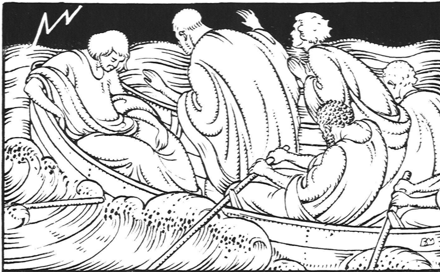
Illustration aus dem Gesangbuch für die evang. Kirche der Kantone Glarus, Graubünden, St. Gallen und Thurgau, von B. Mangold, Maler und Graphiker S. W. B., Basel. Verlag Huber & Co., Frauenfeld

auch die, welche sich um das neue Banner scharen, haben ihre Periode des Suchens, des unsicheren Tastens noch nicht abgeschlossen und ihr Schaffen hat sich noch nirgends zu genügender Bestimmtheit abgeklärt. Ihre künstlerische Energie steht auch in keinem Verhältnis zu den kühnen Befreiungsversuchen, durch die sich z. B. unsere Malerei aus den traditionellen Banden zu lösen wagt.