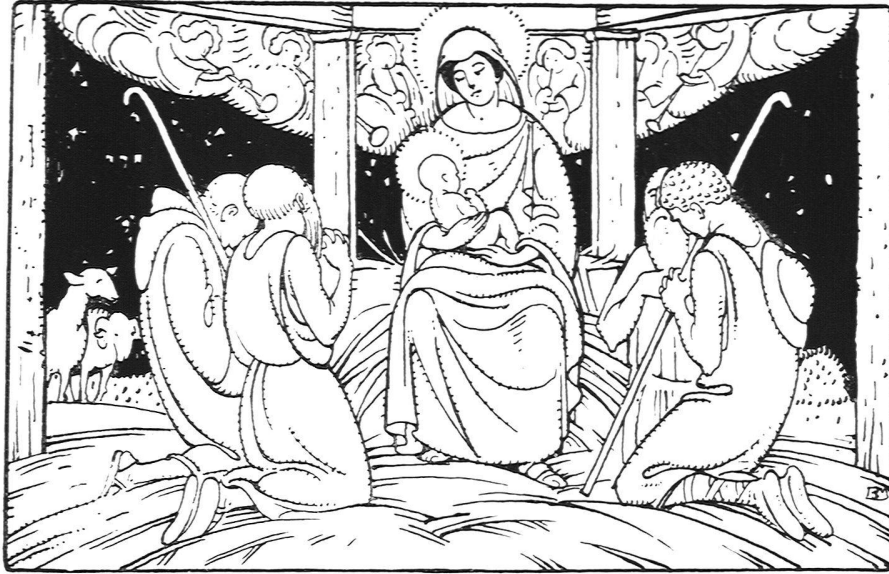
Illustration aus dem Gesangbuch für die evangel. Kirche der Kantone Glarus, Graubünden, St. Gallen und Thurgau, von B. Mangold, Maler und Graphiker S. W. B., Basel. Verlag Huber & Co., Frauenfeld

Die Anregung war von der Bündner Synode ausgegangen und wurde anfangs von den übrigen Kantonen etwas kühl aufgenommen. Um so erfreulicher war das rege Interesse der Verlagsanstalt Huber, die dazu das ganze finanzielle Risiko auf sich zu nehmen hatte. Sie setzte sich mit Burkhard Mangold in Verbindung, der die Aufgabe mit sichtlicher Liebe und innerer Anteilnahme erfaßte. Seine Arbeit liegt heute vor. Es sind ein Dutzend halbseitige Titelbildchen zu den einzelnen Liedgattungen. Ihre Stoffe entnehmen sie teils der evangelischen Geschichte, teils dem täglichen Leben. Dazu kommt ein überaus gelungenes Titelblatt fürs Ganze, das in Idee und Ausführung an die besten Muster älterer Zeiten erinnert. Was an B. Mangolds Werk von Anfang an fesseln muß, ist der durchaus einheitliche, sichere Stil und die klare