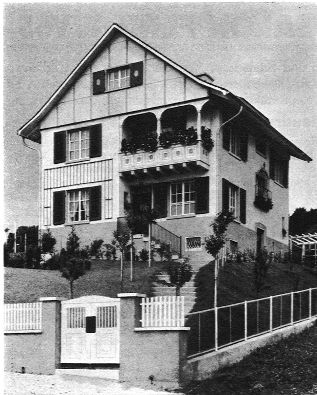
Haus mit Giebel- verkleidung aus Eternit

Grosses Lager aller Sorten technisch. Papiere