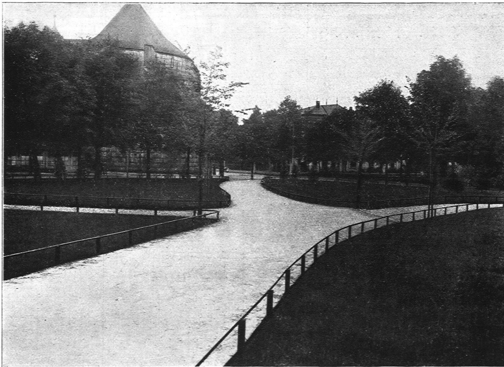
In der Schweiz ausgeführt: 428,000 qm Stadtgarten in Solothurn

Schweiz. Strassenbau-Unternehmung A.-G., Solothurn Teleph. 633