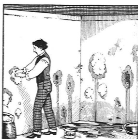
Wasserdurchlässige Stellen in Böden und Wandputz werden mit schnellbindender „SIKA“ verdichtet.