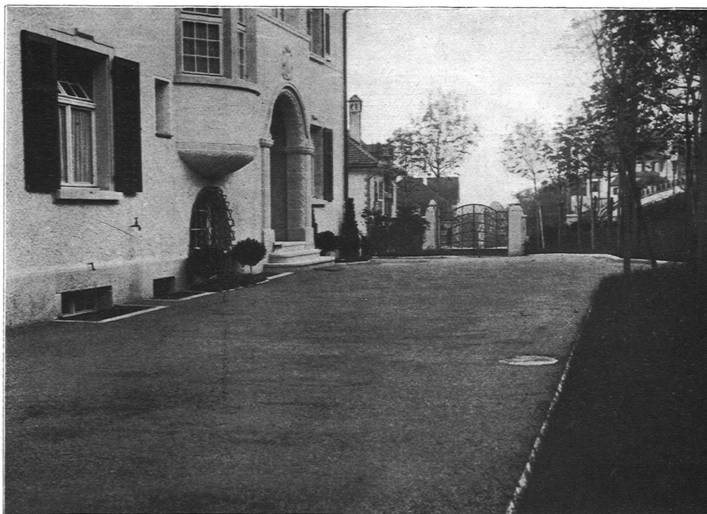
In der Schweiz ausgeführt: 428,000 qm

Schulhaus Ruswil Parterre Hotel Storchen Bern Universität Zürich 250 m 2 Moosmatt-Schulhaus Luzern Verwaltungsgebäude der Schweizer. Unfallversiche- rungsanstalt Luzern.