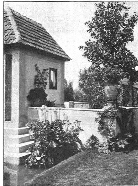
Eine malerische Ecke aus einem unserer Gärten

OTTO FRÖBEL'S ERBEN Gartenarchitekten Zürich 7