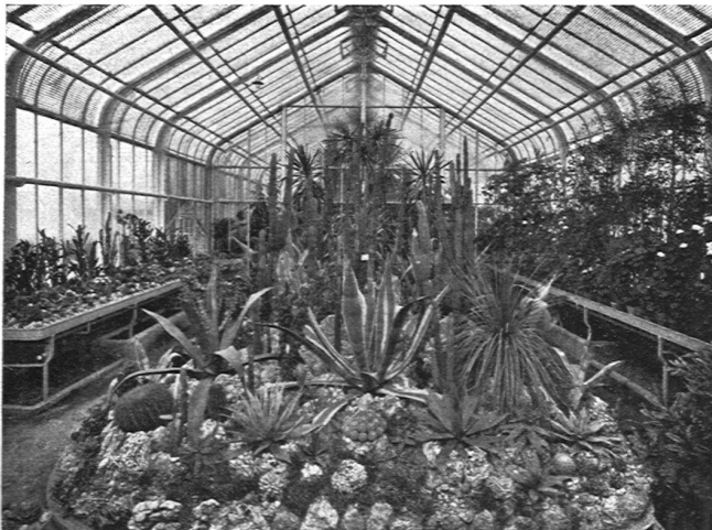
Stadtgärtnerei St. Gallen, beheizt mit Catenakessel