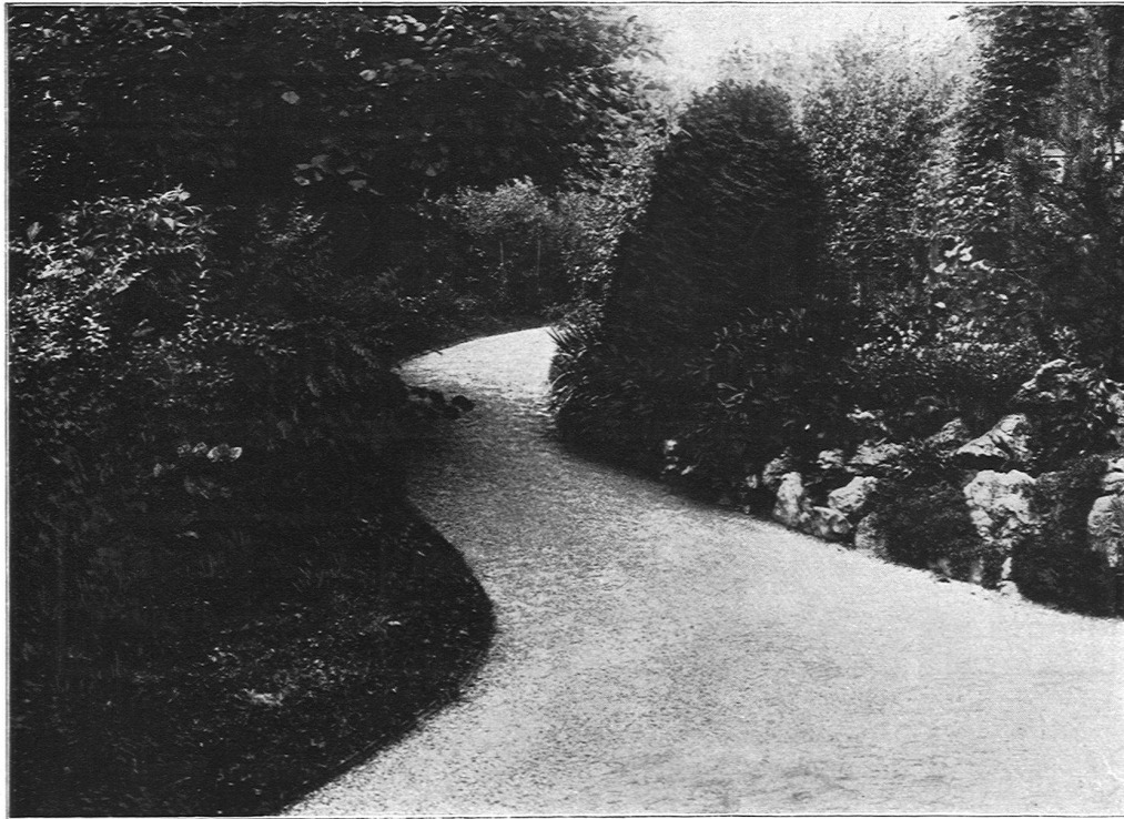
In der Schweiz ausgeführt: 428,000 qm