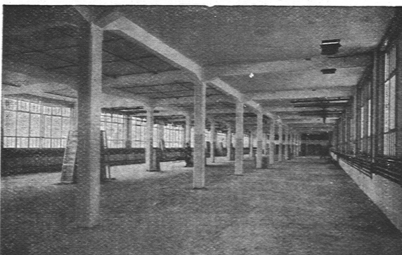
NEUE FABRIKANLAGE C.F. BALLY A.-G., SCHÖNENWERD 12000 m 2

Spring, Burger & Cie., Kaminhutfabrik, Basel