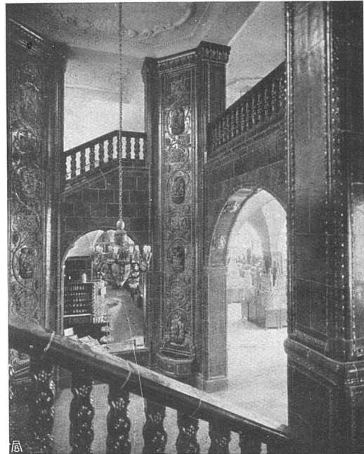
SPONAGEL & Co Mutz-Keramik ZÜRICH Keramische Boden- und Wandbeläge //