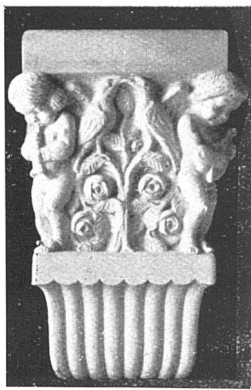
E. PERINCIOLI, Bildhauer Jennerweg 5 BERN Jennerweg 5 Kunst- u. Baudekoration