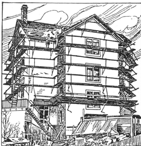
Ganz eingerüstetes Haus

Illustrierte Preislisten gratis und überall jederzeit kostenlose Vorführung durch