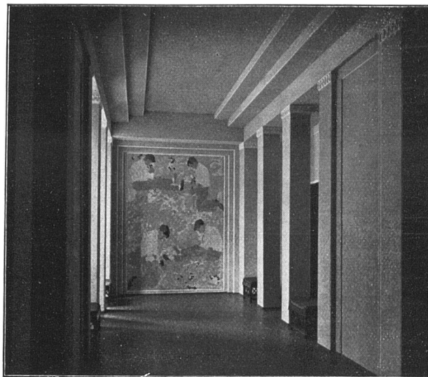
VORHALLE IN ETERNIT