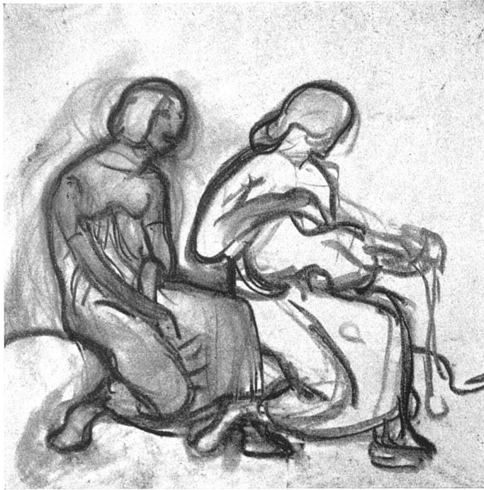
Ed. Stiefel, Zürich

Plakat-Wettbewerb für die Internationale Elektrizitäts-Ausstellung in Barcelona. In dem für die Internationale Elektrizitäts-Ausstellung in Barcelona ausgeschrieben Plakat-Wettbewerb ist die Entscheidung ergangen. Die drei Preise sind an spanische Künstler gefallen.