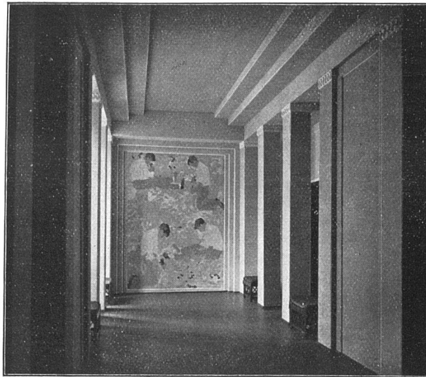
VORHALLE IN ETERNIT