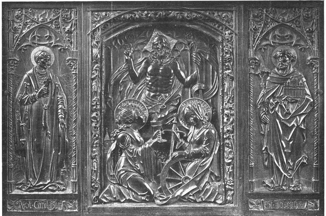
Zwei Familienepitaphien für den Erzbischöflichen Oberbauinspektor in Freiburg i. Br.