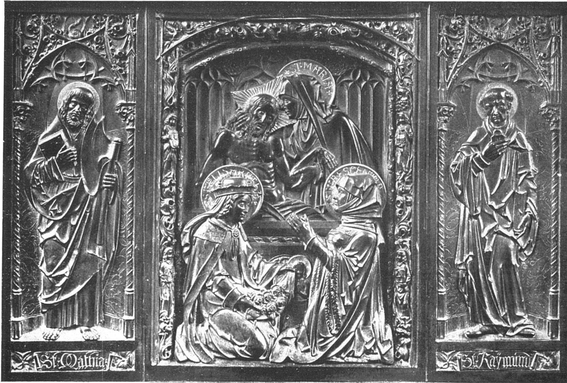
Nach geschnitzten Holzmodellen von Gebr. Mezger, Eberlsche Kunstwerkstätten in Überlingen, in Hohlgalvano ausgeführt von Bl. Bart, Werkstätte für Kunst- und Gewerbliche Metall-Arbeiten, Zürich