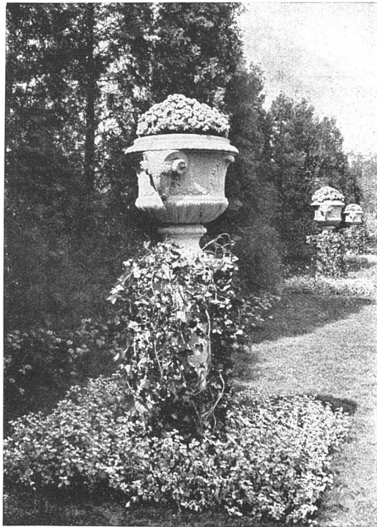
OTTO FROEBEL'S ERBEN / ZÜRICH 7 PROJEKTIERUNG UND AUSFÜHRUNG VON GARTEN- UND PARK-ANLAGEN