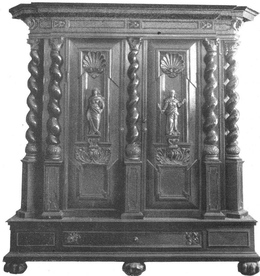
Barockschrank. Schwarz poliert. Frauenfiguren und einige Akanthusornamente vergoldet. Schloss und Flachränder graviert. Um 1700—1720. Höhe 130 cm, Breite 205 cm, Tiefe 76 cm. Auktion Helbing, München.