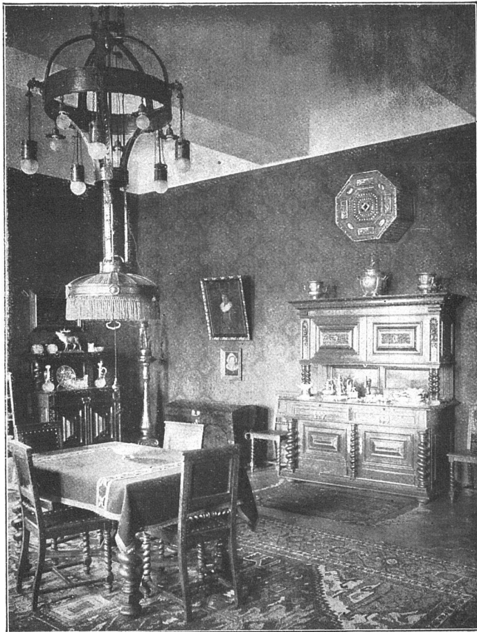
Der Zephir-Lüfter mit Prof. Junkers Lamellen-Kalorifer, ein Apparat zur Ventilation mit vorgewärmter oder gekühlter Luft, für Versammlungssäle, Bureaux- oder Wohnräume, Restaurants, Cafés, Schulen, Hallen, gewerbliche Arbeitsräume etc.

Installation in der Schweiz durch Wanner & Co., A.-G. Abteilung für ventilationstechnische Anlagen, Horgen.