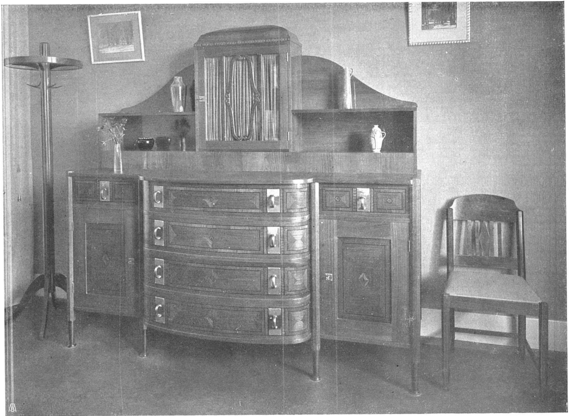
Wäschekommode in Kirschbaum- holz, matt poliert mit Einlagen in Wassereiche BeschlgeMessing matt