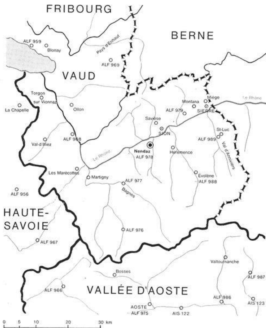
Carte 1. Le Valais romand. Situation de Nendaz par rapport aux localités et aux vallées dont le patois a fait l'objet d'une étude philologique.

Les points d'enquête du GPSR , des Tabl. , de Gilliéron et de Zimmerli ne sont pas tous portés sur la carte.