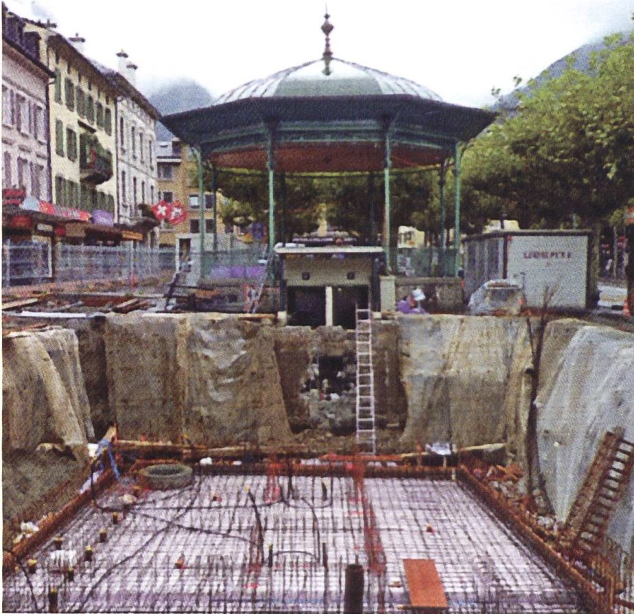
Fig. 1 : Talus permettant de faire des rétrocalculs (Martigny, alluvions de la Dranse, vers 1990).

être faits pour définir les paramètres géotechniques réels.