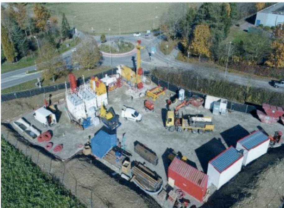
Fig. 1: Bohrplatz mit Bohrgerät und den zugehörigen Installationen und Behausungen.

Der Bohrplatz befindet sich nahe der Ortschaft Satigny, westlich von Genf, neben der Strassenkreuzung Rue de Satigny und Rue de Mandement (Fig. 1). Der rund 1'500 m 2 grosse Bohr- und Installationsplatz ist über eine Zufahrt parallel zur Rue de Satigny erreichbar. Zufahrt und Bohrplatz sind mit verdichtetem Kies stabilisiert. Die Bodener-