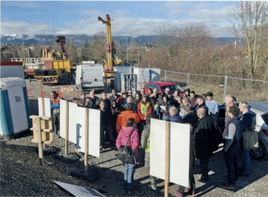
Fig. 2: Einführungen durch den Exkursionsleiter auf der Bohrstelle.