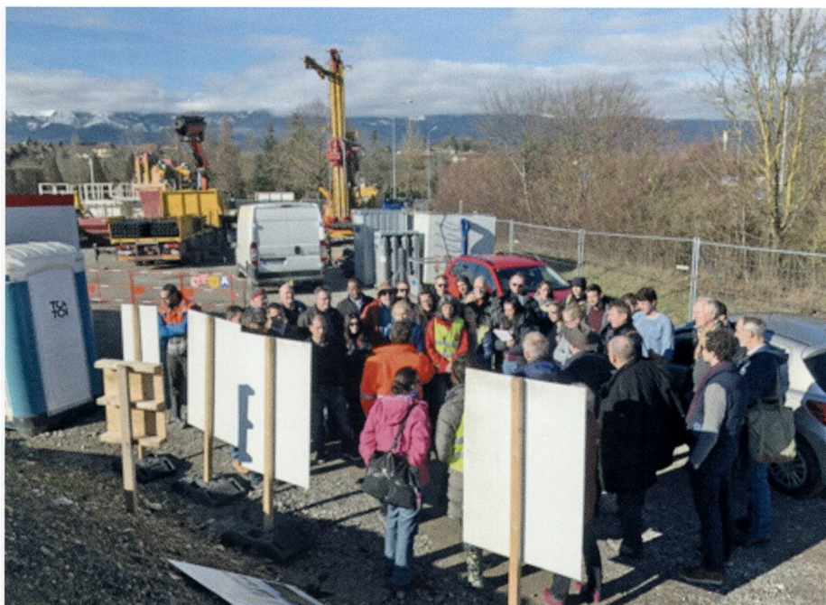
Fig. 2: Einführungen durch den Exkursionsleiter auf der Bohrstelle.