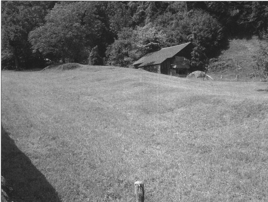
Fig. 3: Ältere Murgangablagerung im Siedlungsgebiet von Unterschwanden. Die Form ist als solche noch erkennbar, allerdings stark geglättet.