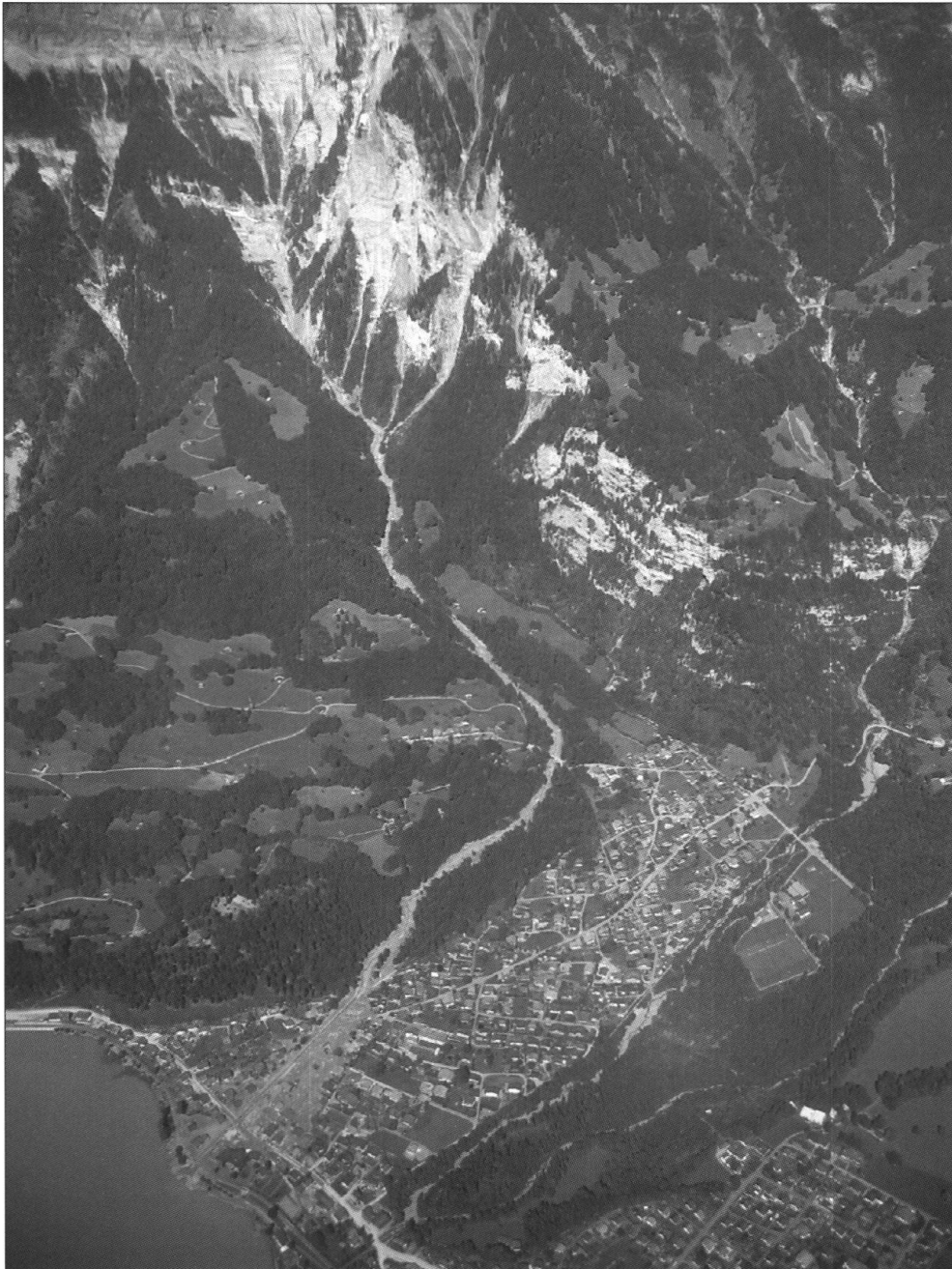
Fig. 1: Glyssibach: Einzugsgebiet und Ablagerungen des Murgangs vom 23. August 2005 auf dem Gemeindegebiet von Brienz. Unterhalb der Rechtskurve des Baches liegt die Siedlung Unterschwanden.

August 2005 haben jedoch gezeigt, dass nach wie vor grössere Unsicherheiten und Herausforderungen bei der Prognose bestehen. Vorliegender Aufsatz beleuchtet einige dieser Ansätze und weist auf die Sicherheit bzw. Unsicherheit bei der Prognose hin. Illustriert werden die Aussagen an Hand des Murgangs vom 23. August 2005 in Brienz (Fig. 1).