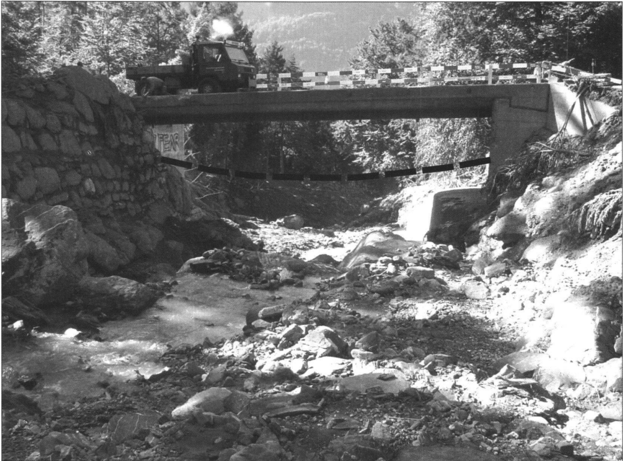
Fig. 5: Querschnitt Glyssenbrücke (Unterschwanden): Vor dem Ereignis betrug die Höhe knapp 2.5 m (gestrichelte Linie), nach dem Ereignis etwa 6 m.