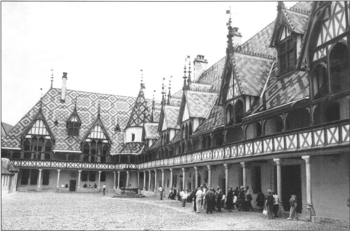
Fig. 1: Das Hôtel-Dieu von 1451 im mittelalterlichen Stadtkern von Beaune während des Besuchs im Rahmen des Partnerprogramms.

Während der administrativen und wissenschaftlichen Sitzungen wurden die Partner/innen durch die schöne Altstadt von Beaune mit ihrem bemerkenswerten Hôtel-Dieu aus dem 15. Jahrhundert geführt.