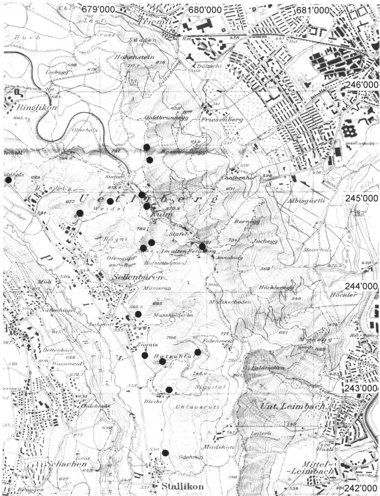
Fig. 1: Lage der wichtigsten Rutschereignisse im Bereich Uetliberg, Mai 1999.