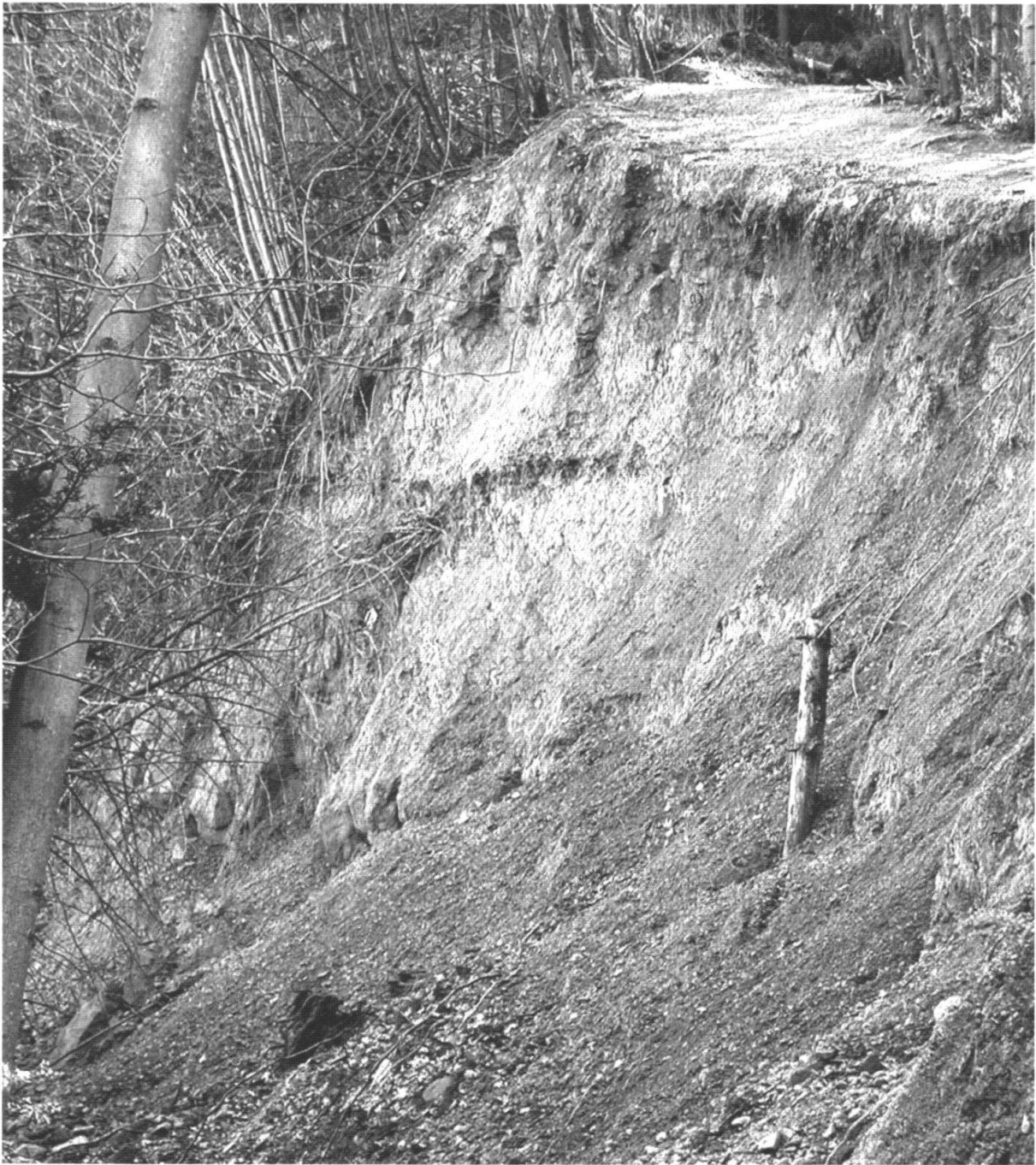
Fig. 2: Anrissrand Rutschung am Gratweg westlich Uto-Kulm.

kon und Mädikon war während der letzten Eiszeit nicht vergletschert, so dass hier die würmeiszeitlichen Moränen fehlen. Auf Uto-Kulm finden sich reliktsche, altpleistozäne, verkittete Deckenschotter aus einer Zwischeneiszeit. Diese überlagern altpleistozäne Moränen. Auf dem Albis sowie auf der Nordflanke des Uetliberges die während der letzten Eiszeit nicht vergletschert waren, lagern über der Molasse lokal risseiszeitliche Moränen geringer Mächtigkeit.