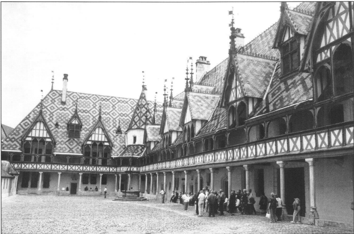
Fig. 1: Das Hôtel-Dieu von 1451 im mittelalterlichen Stadtkern von Beaune während des Besuchs im Rahmen des Partnerprogramms.

Während der administrativen und wissenschaftlichen Sitzungen wurden die Partner/innen durch die schöne Altstadt von Beaune mit ihrem bemerkenswerten Hôtel-Dieu aus dem 15. Jahrhundert geführt.