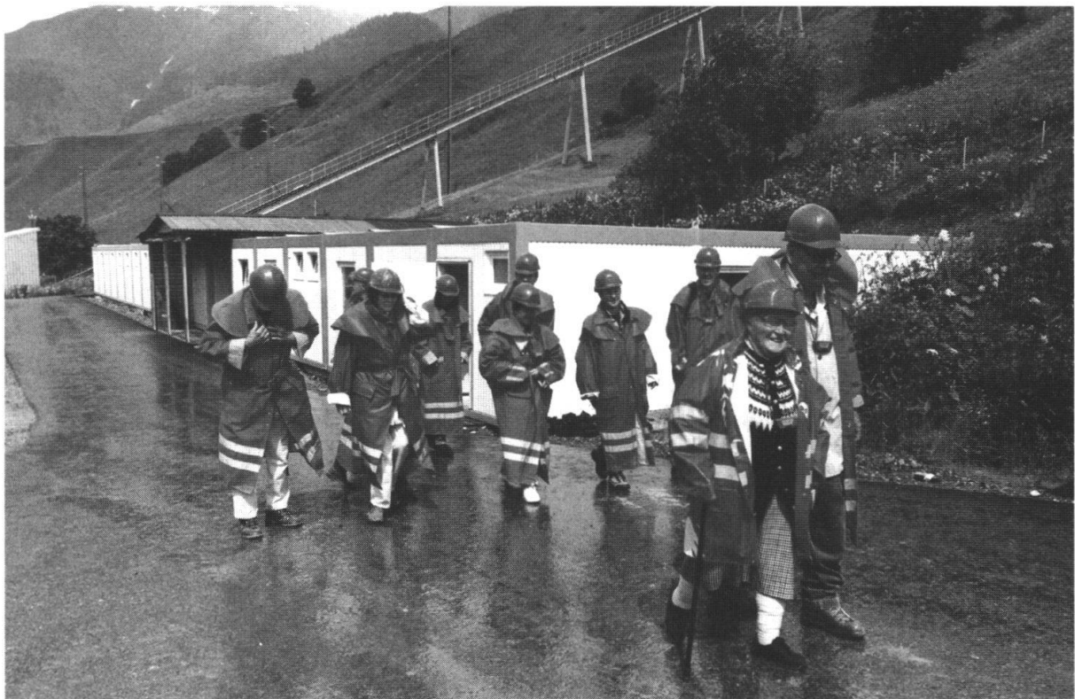
Bild 4: Montagsexkursion: Die Teilnehmer sind bereit für die Begehung des Zugangstollens zum Schacht Sedrun.