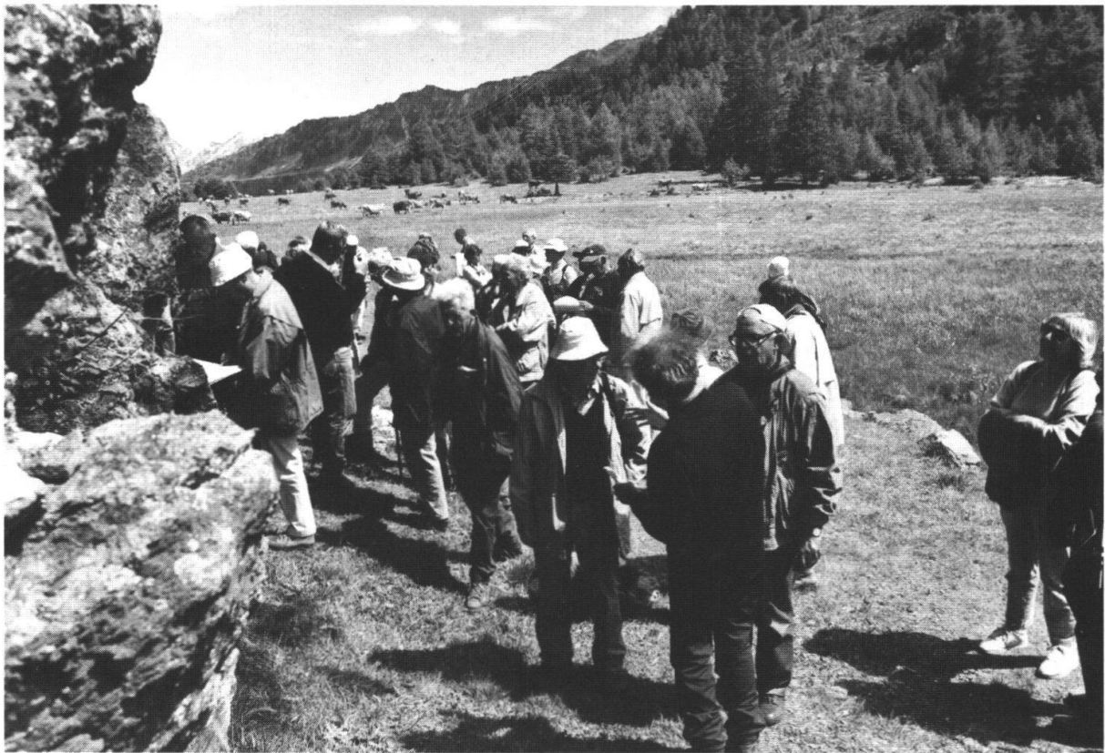
Bild 3: Sonntagsexkursion: Der metamorphe Lias von Frodalera. Die Granat-Hornblende-Gneise sind ein ganz besonderer Augenschmaus.