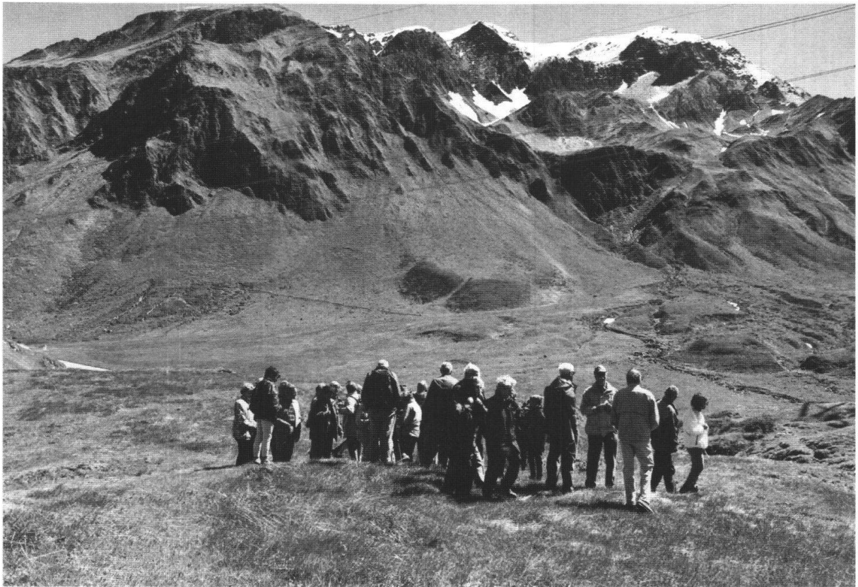
Bild 1: Sonntagsexkursion auf dem Lukmanier: Während sich die einen mit dem Profil der Scopi Zone beschäftigen, befasst sich hier der andere Teil mit der Botanik.