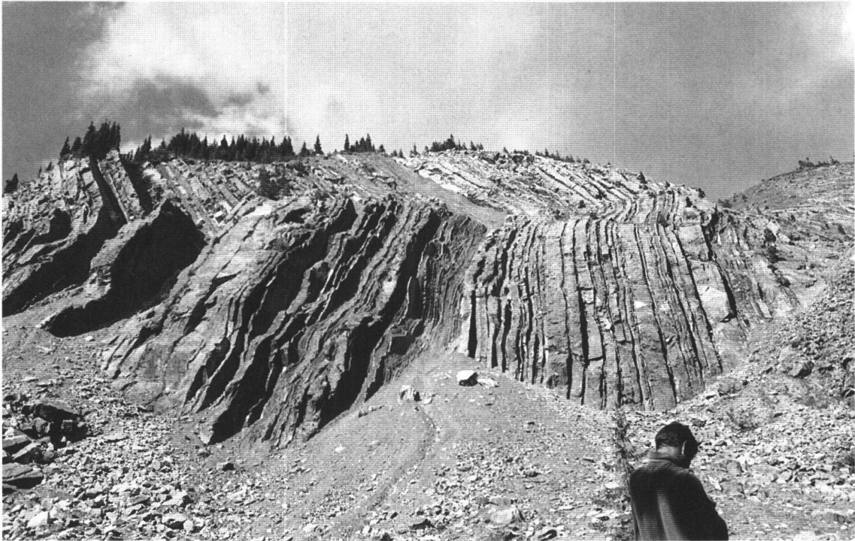
Bild 6: Die unentwegten werden von PD Dr. Wilfried Winkler (Bild 5) und Dr. H.-P. Mohler zum schönsten Flyschaufschluss der Schweizer Alpen geführt. In der Abrissnische des Sörenberger Bergsturzes können die Turbiditsequenzen des Schonisandsteins im eozänen Schlierenflysch bis ins kleinste Detail studiert werden.