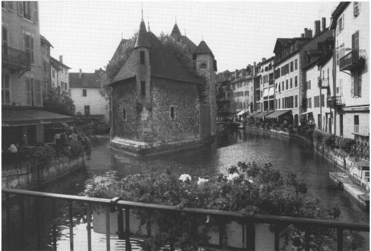
Fig. 1 Annecy - Venise de la France