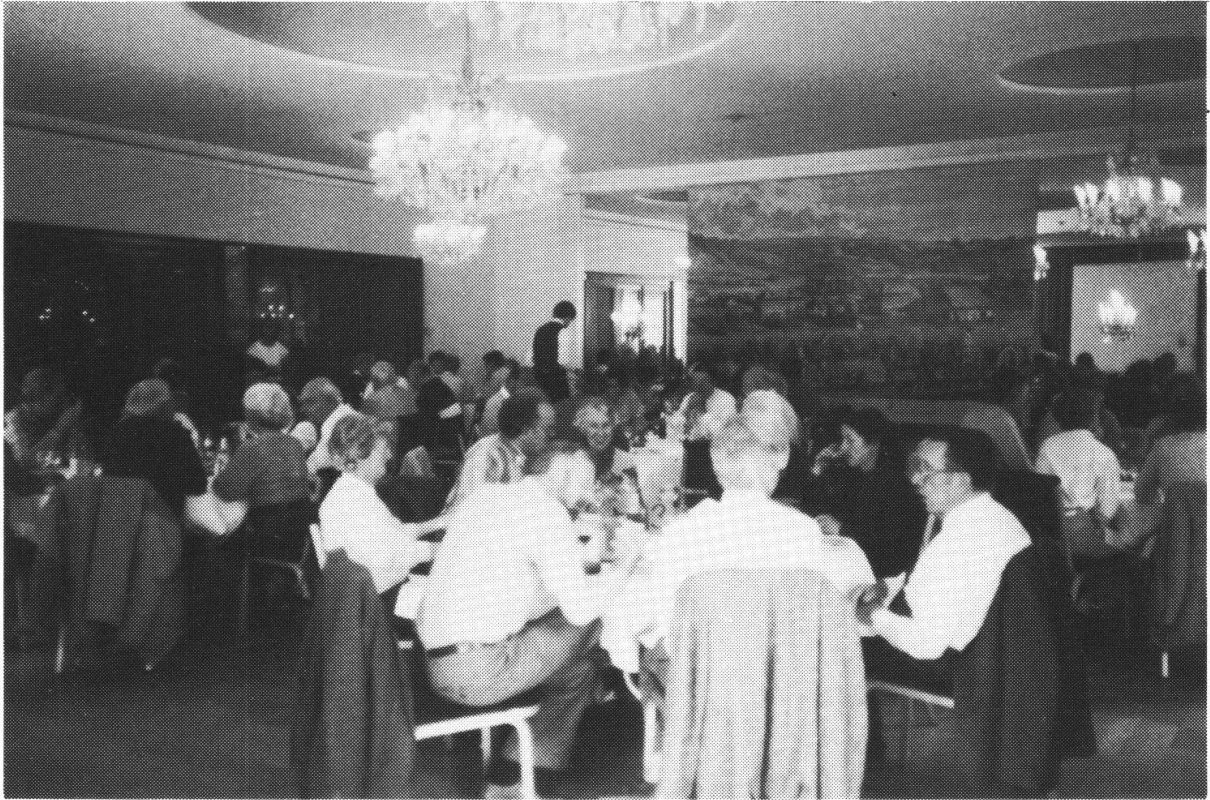
Letztes Mittagessen im Bad Schinznach.

Die alte Fassung von Schinznach-Bad stammt aus dem Jahre 1827, wurde mehrmals verbessert und besteht aus einem rund 3 m weiten und 8 m tiefen Holzschacht, welcher den grundwasserführenden Kies durchstösst und auf dem thermalwasserführenden Dolomit steht. Er wird seit 1980 nicht mehr benützt.