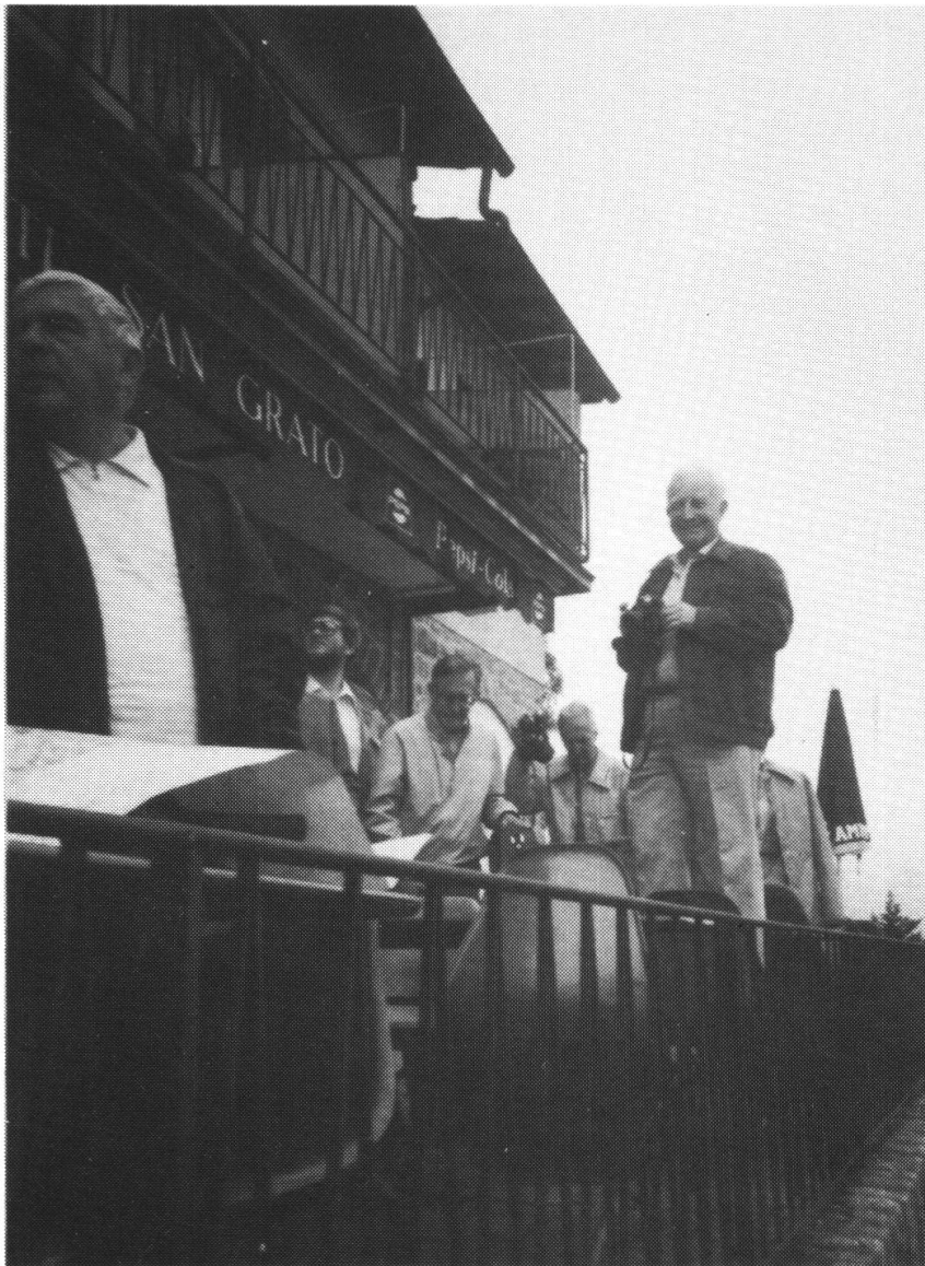
Und hier der Präsident wie er obige Photo aufnimmt.