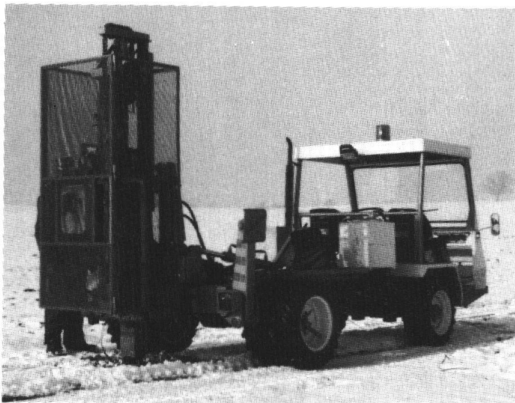
Fallgewicht als umweltfreundliche seismische Anregung