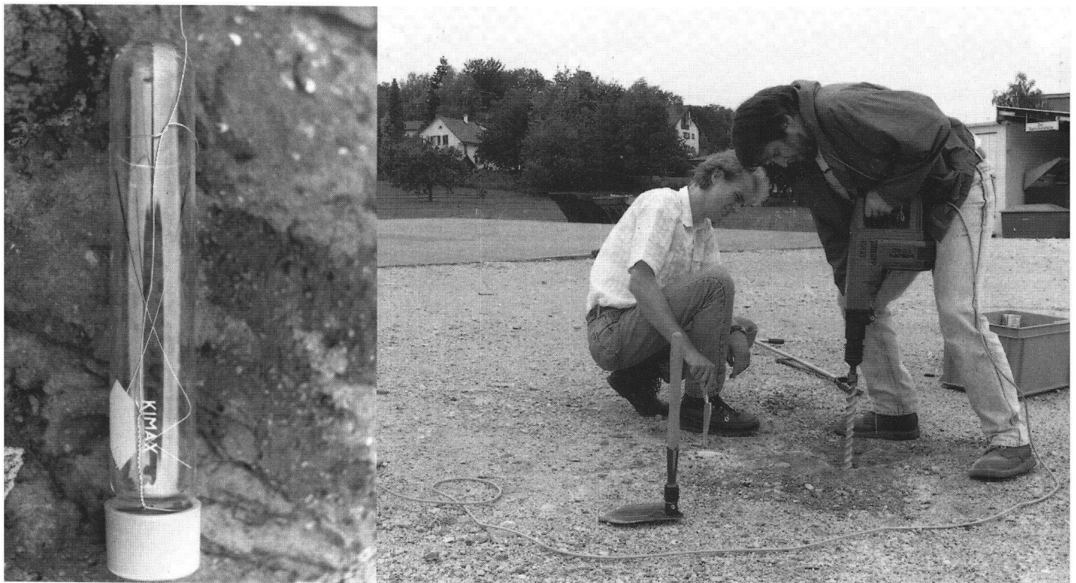
Figur 1: Erkundung einer Altlast mittels der PETREX Bodengas-Technik. Passivkollektoren mit Aktivkohle-Rezeptoren (rechtes Bild) werden in untiefe Bohrlöcher versetzt (linkes Bild).