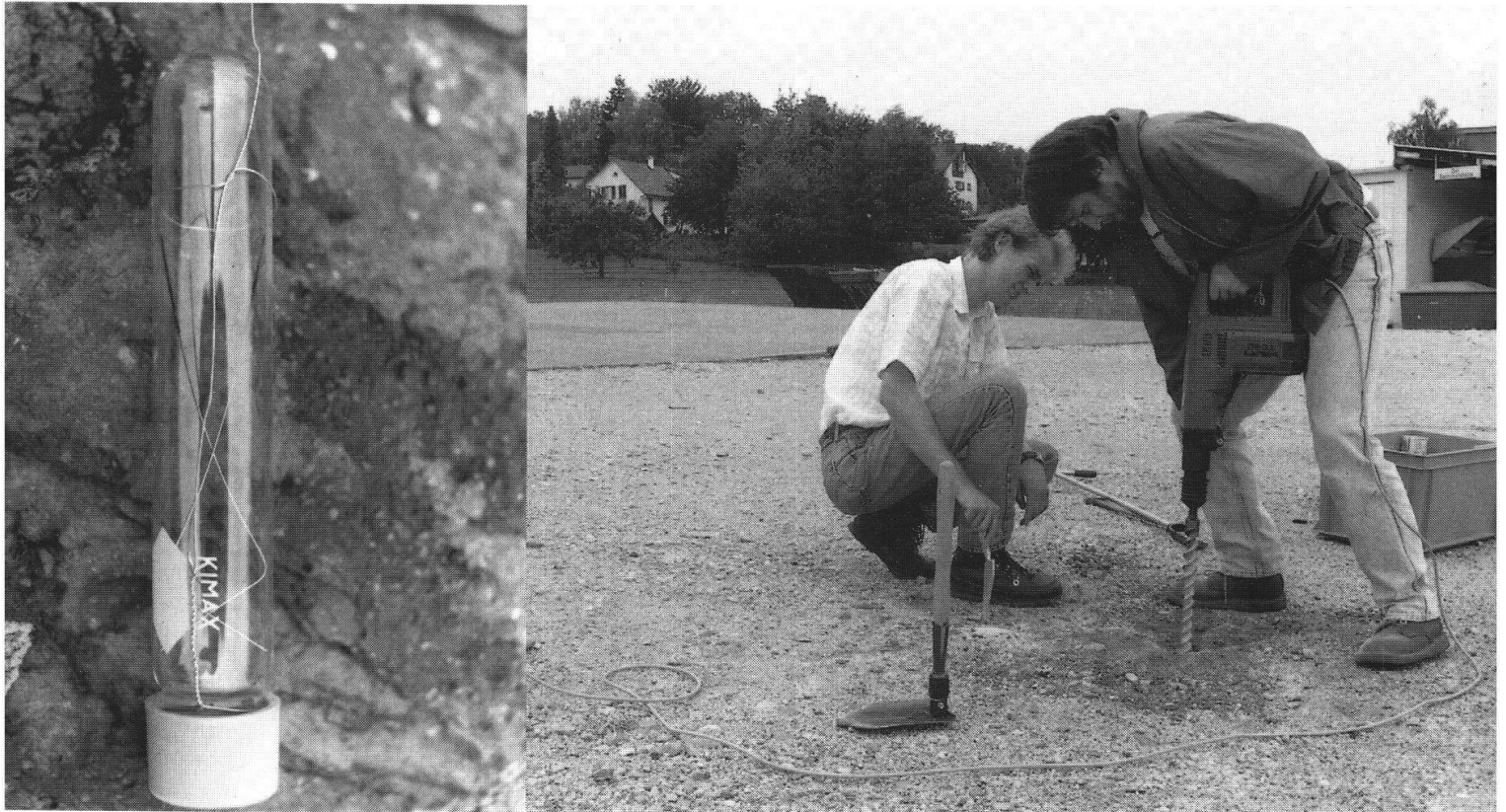
Figur 1: Erkundung einer Altlast mittels der PETREX Bodengas-Technik. Passivkollektoren mit Aktivkohle-Rezeptoren (rechtes Bild) werden in untiefe Bohrlöcher versetzt (linkes Bild).